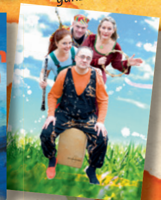
Vom Warm-Up der Sinne bis zum Rate-Rap