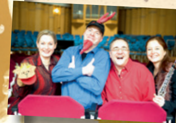
Kindertheater des Monats NRW im Sommer 2007