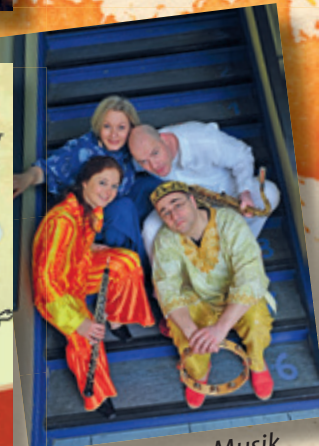
Elementare Musik für die ganze Familie